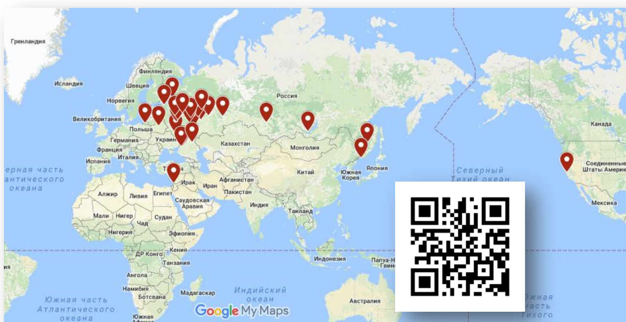
Рис. 1. Карта участников Форума